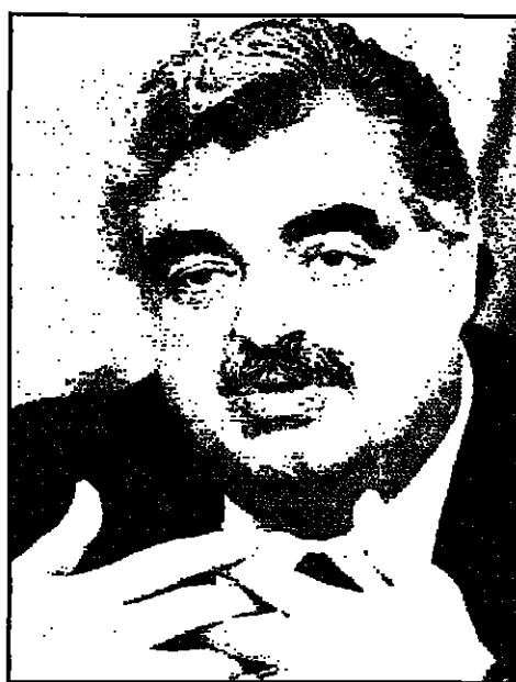
بيروت - القلم العربي - من ندى عبد الصمد:

لم يسجل أي مسمى حتى الآن لترميم العلاقة بين رئيسي المجلس النيابي نبيه بري ورئيس الحكومة رفيق الحريري بعد السجلات العتيفة التي سجلت بين الرجلين وكان آخرها وصف الرئيس بري للحريري بالمرتبك والسياسي الباطل الذي يمارس السلطة باسمه وبأمره باسمه وبالقرابة التي تربطه بالملك العام والملك الخاص.